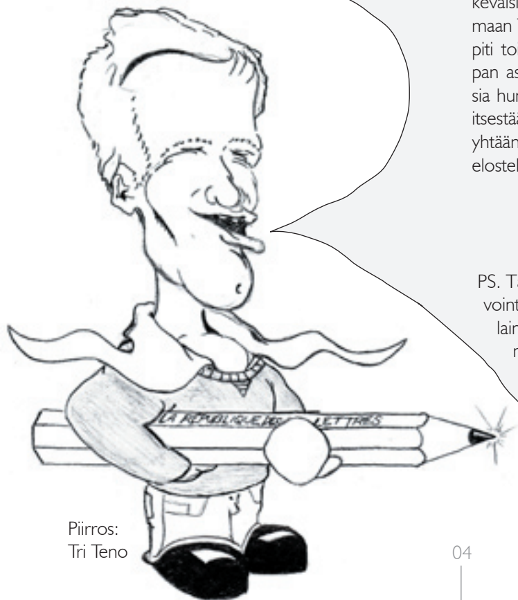
Piirros: Tri Teno

PS. Tämän numeron teemaksi valitiin Hyvinvointi. Lukijan arvioitavaksi jää, onko aiheessa lainkaan pysytty. Periaatteena oli, että kaikki mikä ei ole suoranaista pahoinvointia on hyvinvointia, ja pahoinvoinnistakin saa kirjoittaa, koska muuten näkökulma olisi liian yksipuolinen.