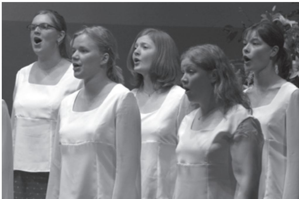
I konsertuppställning.

tillsammans, och flera generationer av lyror kan dela med sig av sina minnen av resor, konserter, kördräkter och fadäser av olika slag. Under kvällens lopp blir det också skivrelease: Lyrans åttonde skiva, Pärlor , ges ut. Skivan innehåller stycken som under de gångna 60 åren har kommit att bli favoriter i körens repertoar. En efterlängtat inspelning för alla Lyran-fans.