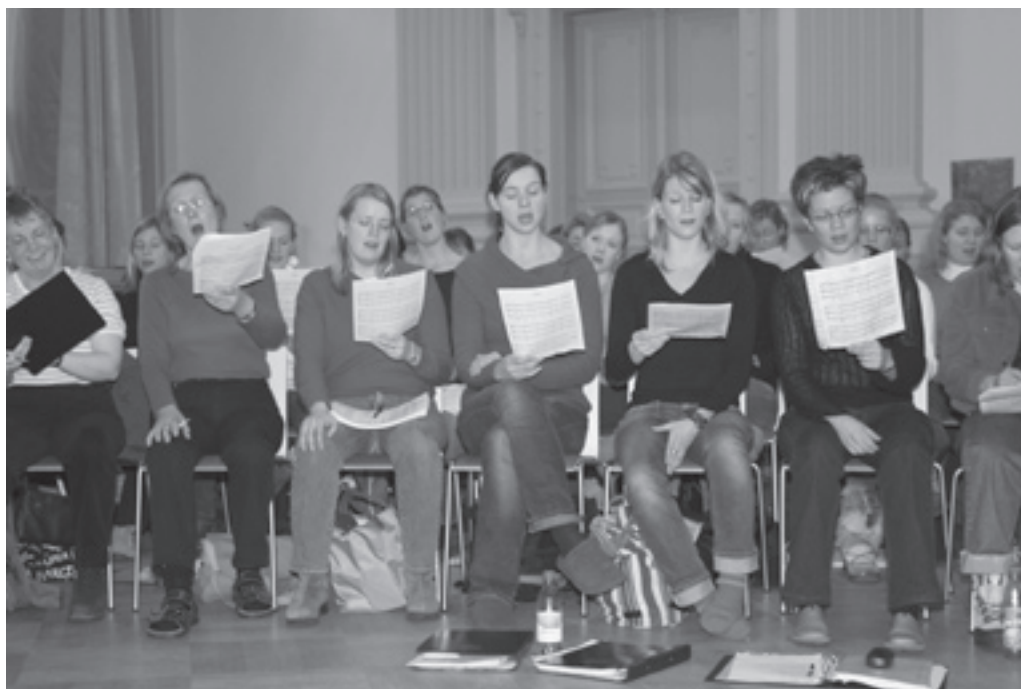
Det krävs en hel del extraövningar under vintern att nöta in jubileumsrepertoaren.

Lyrans 60 år kommer alltså att firas under hela år 2006, och förutom jubileumskonsert och ny skiva kommer Lyrans också ut med en ny intern stamrepertoarbok och en festskrift, Nya Vägar . Jubileumskonserter hålls förutom i Helsingfors också i Åbo och Borgå senare i vår, och i maj reser kören till Österbotten för att delta i Finlands svenska sång- och musikförbunds stora sångfest som i år hålls i Vasa, stadens 400-årsjubileum till ära. Vi kan bara gratulera staden och konstatera jämna år är en underbar orsak att fira!